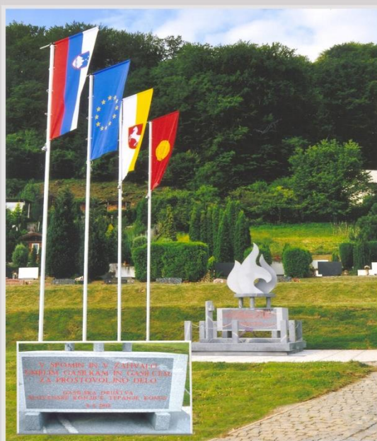
Gasilsko spominsko obeležje na javnem pokopališču Slovenske Konjice

Na Gasilskem spominskem obeležju je dne 30.8.2012 Dr. Danilo Türk, Predsednik R Slovenije prižgal svečo v spomin na umrle gasilke in gasilce.