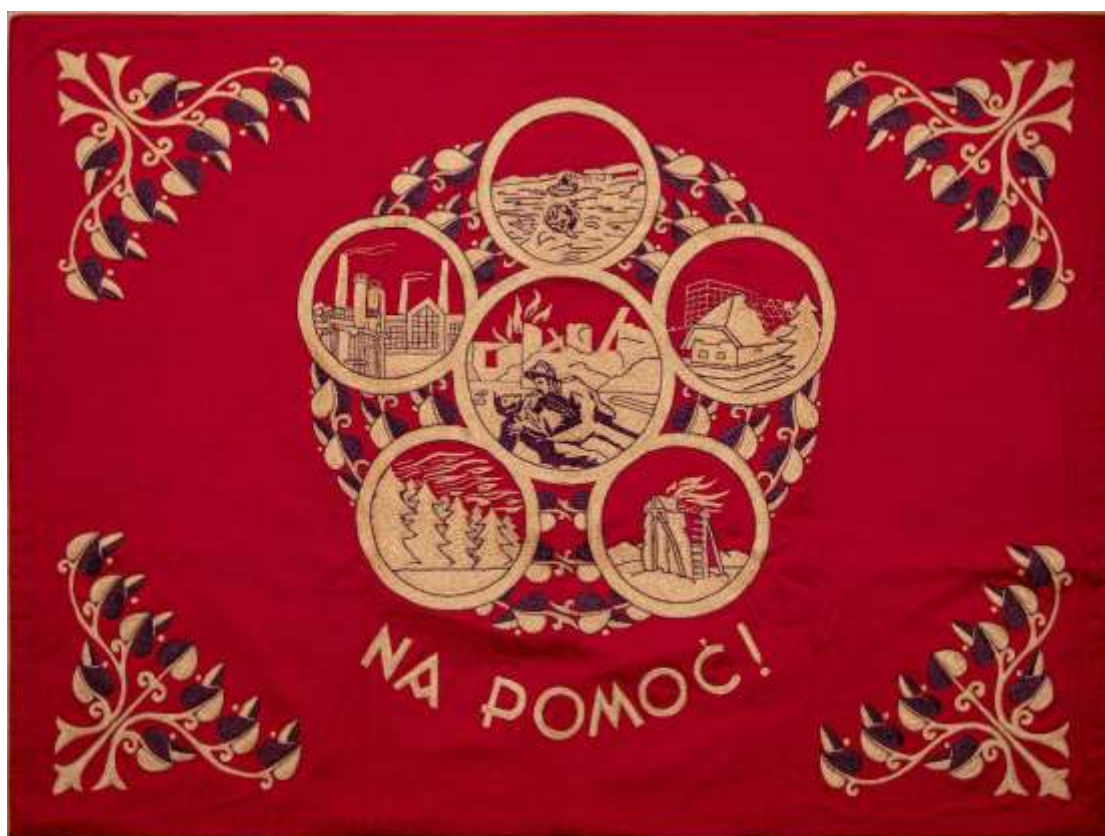
Slika zadnje strani prapora GZS