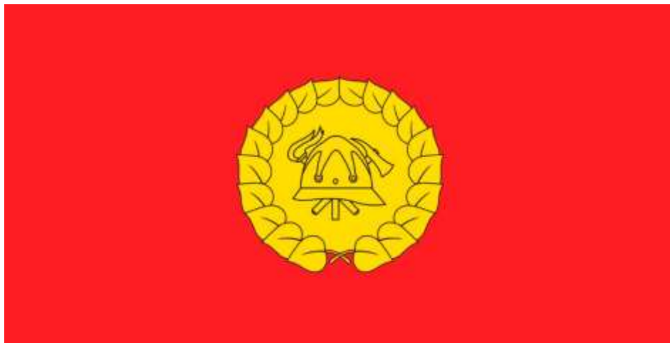
Slika gasilske zastave v horizontalni postavitvi