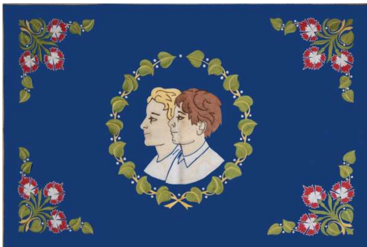
Slika zadnje strani prapora mladine GZS