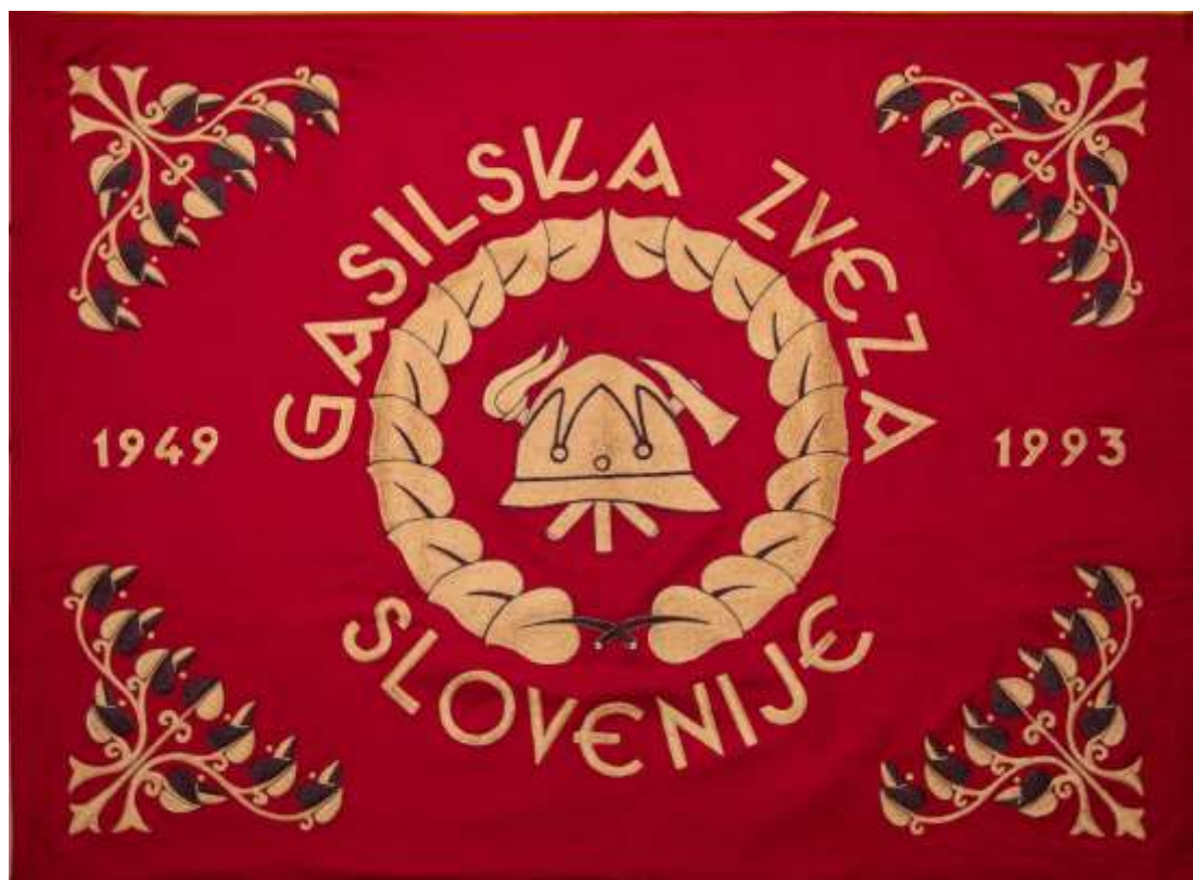
Slika sprednje strani prapora GZS