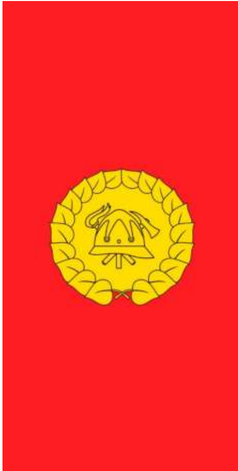
Slika gasilske zastave v vertikalni postavitvi

Gasilska zastava je rdeče barve, v razmerju dolžina : širina = 2:1, v vertikalni ali horizontalni izvedbi. V sredini zastave je grb, ki je postavljen pokončno na viseči zastavi. Gasilska zastava se lahko izobesi na gasilskih prireditvah in gasilskih objektih.