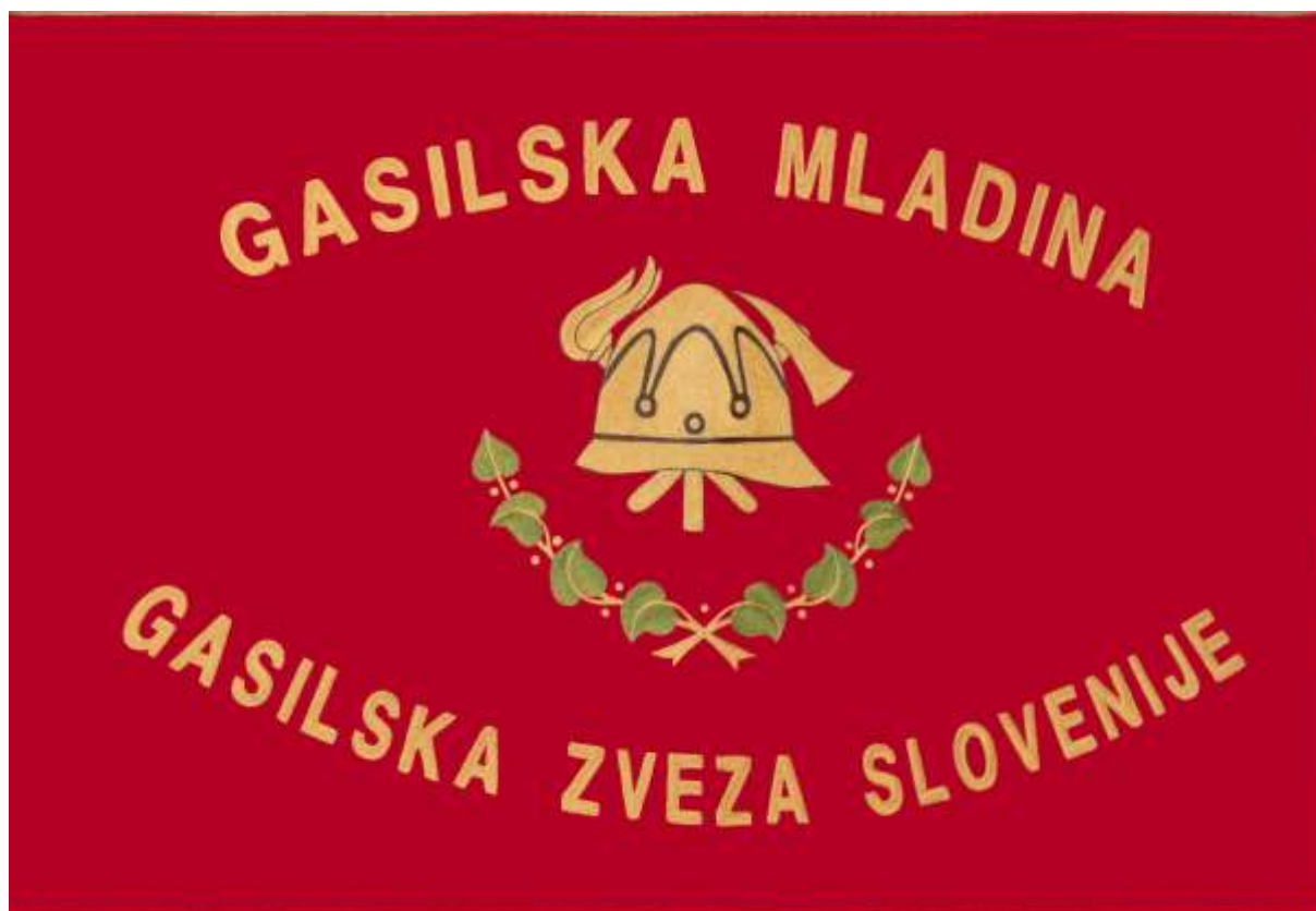
Slika sprednje strani prapora mladine GZS