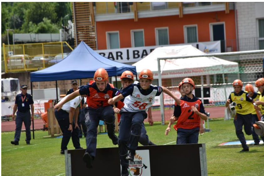
PGD Drenov Grič-Lesno Brdo