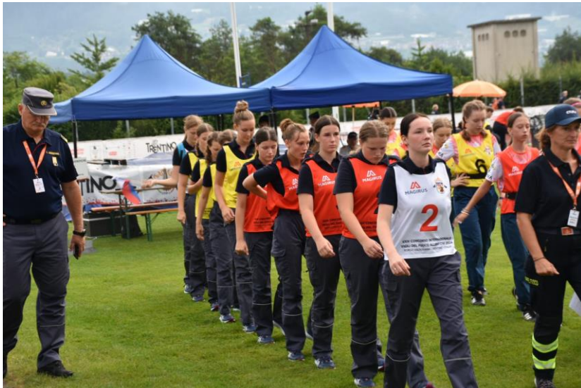
PGD Andraž nad Polzelo