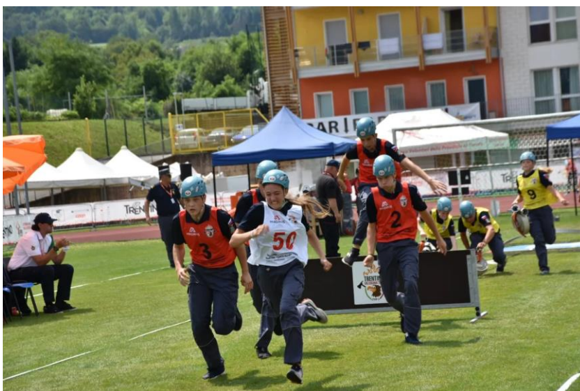
PGD Zgornji Tuhinj